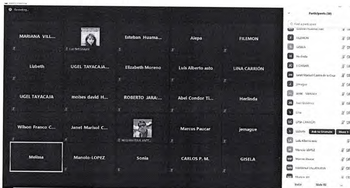
Figura 6: I Taller vía plataforma zoom.

Se adjuntan las evidencias de las intervenciones realizadas por la especialista.